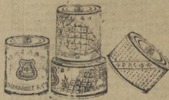
頭 梨 黃